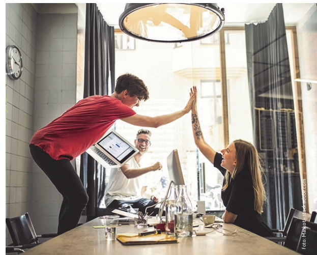
Theorie und Praxis verbinden - wie genial dual!

Als Serviceeinheit des zuständigen Wissenschaftsministeriums bündelt die Duale Hochschule Rheinland-Pfalz das gesamte duale Studienangebot durch eine zentrale Informationsplattform und agiert als Servicestelle für Studieninteressierte, Hochschulen und Unternehmen. Die dualen Studienangebote sind dabei Angebote der einzelnen Hochschulen des Landes. Auch durch die Etablierung dualer Masterstudiengänge und die Entwicklung internationaler dualer Studienangebote wird die Duale Hochschule ein wesentliches Element in der Zusammenarbeit zwischen