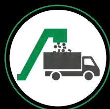
Be- & Entladesysteme